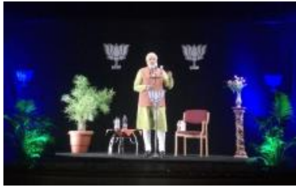
Narendra Modi bei einem Auftritt, der an 53 Orten gleichzeitig stattfand.

Er ließ sich von einem Spezialhersteller eine transparente Folie liefern, besorgte sich hochauflösende Kameras und Projektoren aus Südkorea – in Deutschland arbeitete zu dieser Zeit kaum jemand in HD. Am 31. August 1996 meldete Maass beim Europäischen Patentamt in München sein Patent an: »Verwendung eines Bildprojektors, einer reflektierenden Fläche und einer glatten reflektierenden oder teilreflektierenden Folie zum Darstellen von Bildern im Hintergrund einer Bühne.«