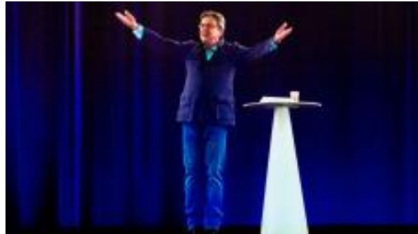
Hologramm von Jean-Luc Mélenchon

Es ist nicht Jean-Luc Mélenchon, der hier auf der Bühne steht, sondern sein Hologramm. Mit Hilfe innovativer Technik trat der Politiker am 18.4.2017 an sieben verschiedenen Orten gleichzeitig auf. →