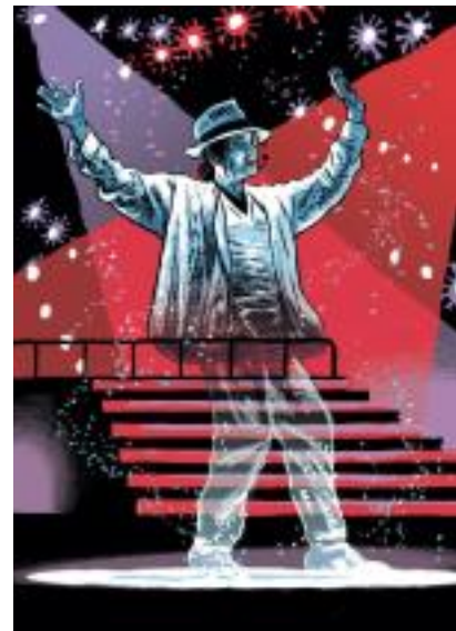
Michael Jackson war seit fünf Jahren tot, als er bei den Billboard Music Awards 2014 in Hologramm-Form auftrat.