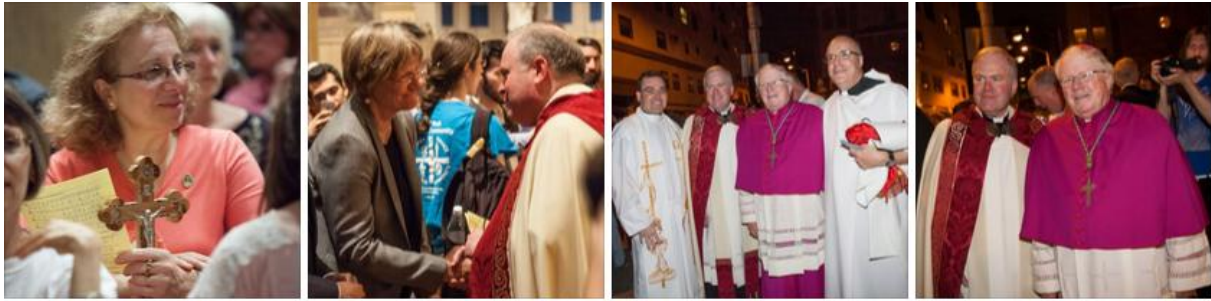
Holy Hour in Reparation for Acts Committed Against the Eucharist Von Archdiocese of Boston · am Montag aktualisiert