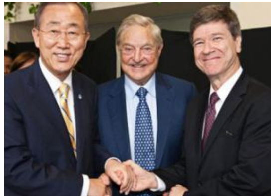
Ban Ki-moon, George Soros und Jeffrey Sachs

Seit dem Frühjahr 2015 häufen sich die Stimmen, daß mit Papst Franziskus ein neomalthusianischer Geist Einzug im Vatikan gehalten habe. Eine schwerwiegende Entwicklung, die vor allem die Lebensrechtsbewegung aufschreckte. Da die USA, besonders unter den Präsidenten Bill Clinton und Barack Obama, eine neomalthusianische Politik betrieben; da in den 90er Jahren unter Clinton